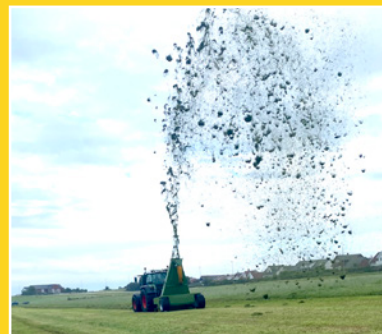
Demonstrasjon av kasteevne.