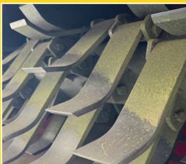
Hardox sliteplater i rotorhus